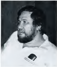
Waar zit het onderwijshart van deze gedeputeerde?

komt. Heeft het bijzonder onderwijs in deze situatie wel recht van bestaan? Heeft het eigene, waarover in alle statuten wordt gesproken, wel die functie die in deze statuten zo mooi geformuleerd wordt? Onderscheidt het bijzonder onderwijs zich hierin echt van het openbaar onderwijs? Het antwoord moet ontkennend luiden. Op het Colegio Arubano wordt de Rooms Katholieke grondgedachte nauwelijks of niet meer uitgedragen. Zonder statutenwijziging heeft het Colegio Arubano trouwens haar "openstaan voor alle gezindten" steeds meer gepropageerd. Het geven van godsdienstlessen is toch niet de enige reden waarom een school "bijzonder" genoemd zou moeten worden? Ook in het openbaar onderwijs kan in volledige vrijheid godsdienst op het rooster geplaatst worden. Is het bij een praktisch geheel katholieke bevolking wel nodig een deel van de kerkelijke (en ouderlijke) taak onder te brengen bij het bijzonder onderwijs? Hebben de scholen van de SPCOA wel de, in de statuten opgenomen, protestants-christelijke signatuur? De werkelijkheid laat iets anders zien. Met name de protestants-christelijke scholen op Aruba hebben het imago, dat daar het beste onderwijs in het Nederlands gegeven wordt. Niet de protes-